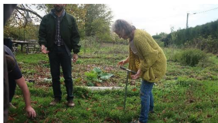
Atelier analyse de site