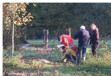
Analyse de site

École de La forêt gourmande – 21 Route des Gauthes, 71330 Diconne - FRANCE