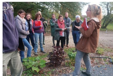
Découverte du jardin-forêt de Meursault