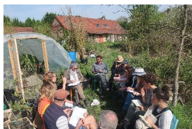
Atelier multiplication des végétaux