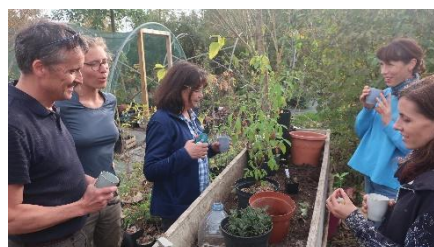
Atelier multiplication des végétaux