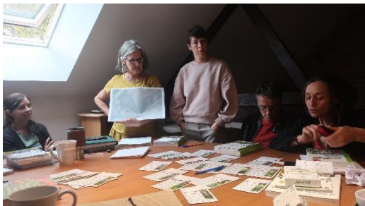
Exercice de conception en collectif