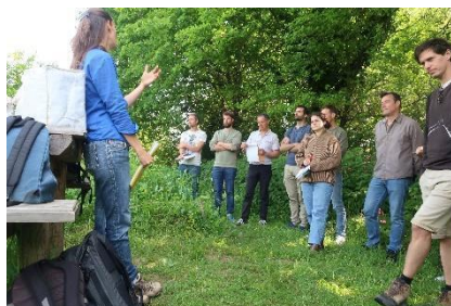
Visite commentée du jardin-forêt expérimental